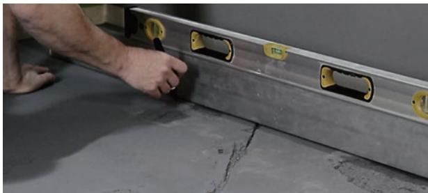
Preparación del soporte. Preparing the support.

La superficie de colocación debe ser plana, firme, estable, compatible con el material de agarre y estar limpia.