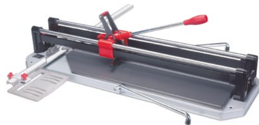
Cortadora manual. Manual cutter.