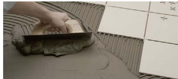
Aplicación del adhesivo. Adhesive material application.

The surface for placing the tiles must be flat, firm, stable, compatible with the binding material, and clean.